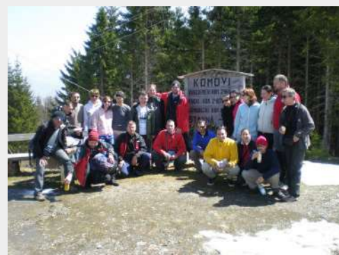
Cela družina na okupu

Voda: Milan Pamučar – PD „Pobeda“, Beograd