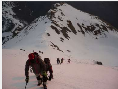
Strma deonica i jaki udarci vetra

U 10.00 krećemo u obližak terena kako bismo sagledali sve uslove i pripremili se za uspon. S obzirom da je jutro već podmaklo i da je sneg prilično razvodnjen, donosimo odluku da na uspon krenemo u nedelju u ranim jutarnjim časovima. Ostatak tog dana proveli smo opuštajući se na suncu, uživajući u lepom vremenu i pripremajući se za predstojeći uspon. Uveče smo imali sastanak, u toku razgovora sa vođama nekoliko planinara odustaje od uspona.